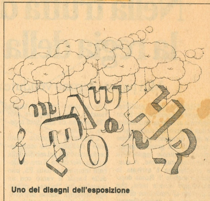
Uno dei disegni dell'esposizione

Infine Paola Mazzetti che nei suoi sogni alla Chagall stende il proprio acquarello oltre la realtà dove cavalli dai contorni poco riconoscibili volano e un corpo decapitato si protende verso una testa gigantesca che sembra una enorme luna piena.