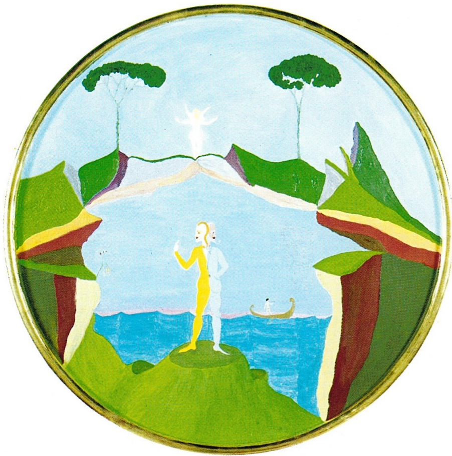
NOSTALGIA DI GIANO E GIASONE