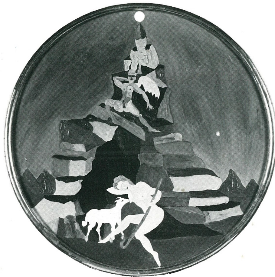
EDMIONE E DEMONIO