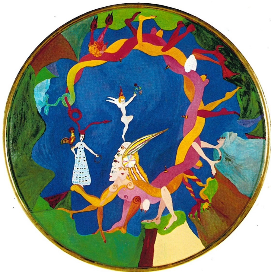
SFINGE GENIO E GELOSIA