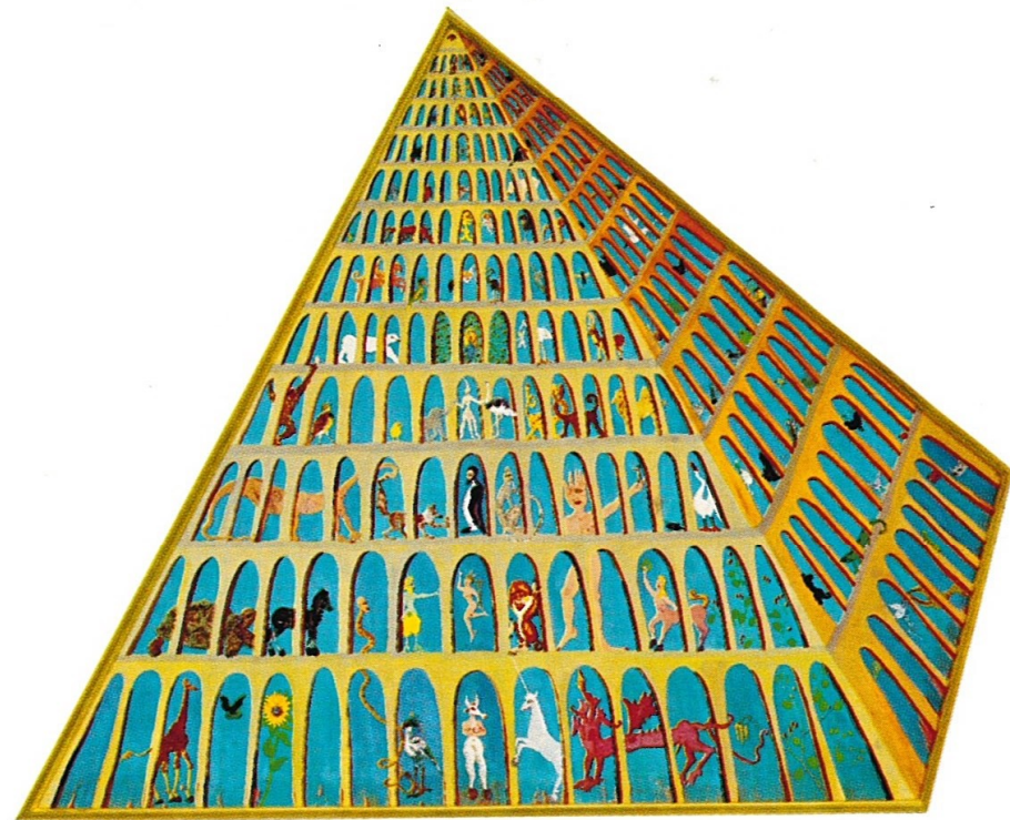
PIRAMIDE DI SODOMA