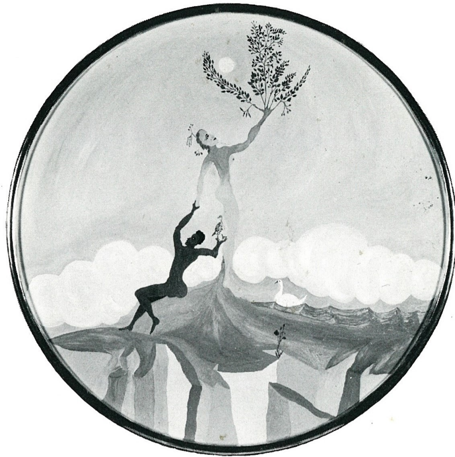
DAFNE E DEFICIENTE