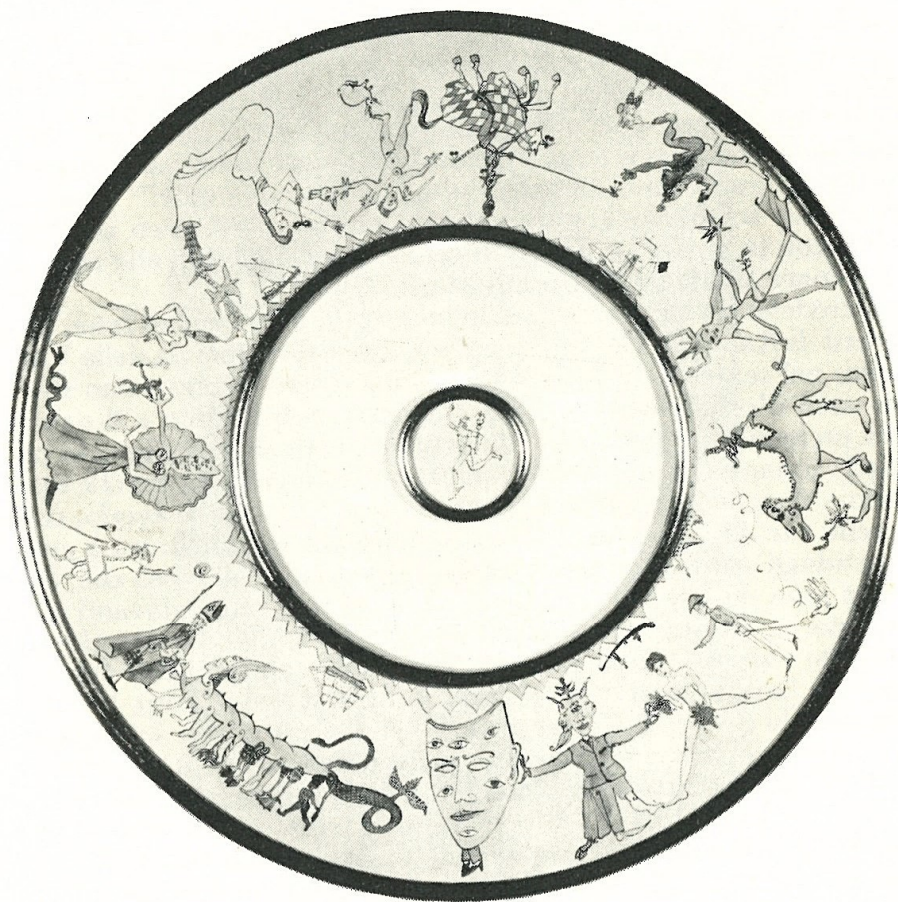
BATTAGLIA NAVALE IN CARNEVALE

alto 1,95 e lungo, 1,60 dalla punta del naso all'attaccatura della coda. È certo che appena lo vidi, capii subito che non era solo ma che era l'avanguardia di qualcosa che sarebbe venuto al suo seguito. Non sapevo bene che cosa, cioè quale altro amabile mostro, ma mi balenò per un attimo l'idea (e non sembri mancanza di rispetto per Ontani) di un corteo di fantastiche creature di cartapesta sul genere del Carnevale di Viareggio. Un carnevale a suo modo, s'intende, come a Viareggio non c'è mai stato né mai ci sarà a meno che non sia Ontani a inventarlo tutto lui dal primo carro all'ultimo.