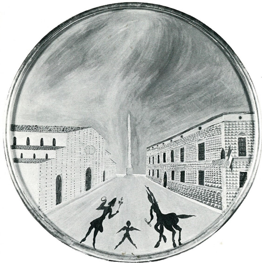
OMBRE BREVI DI BRAVI O D'AVI