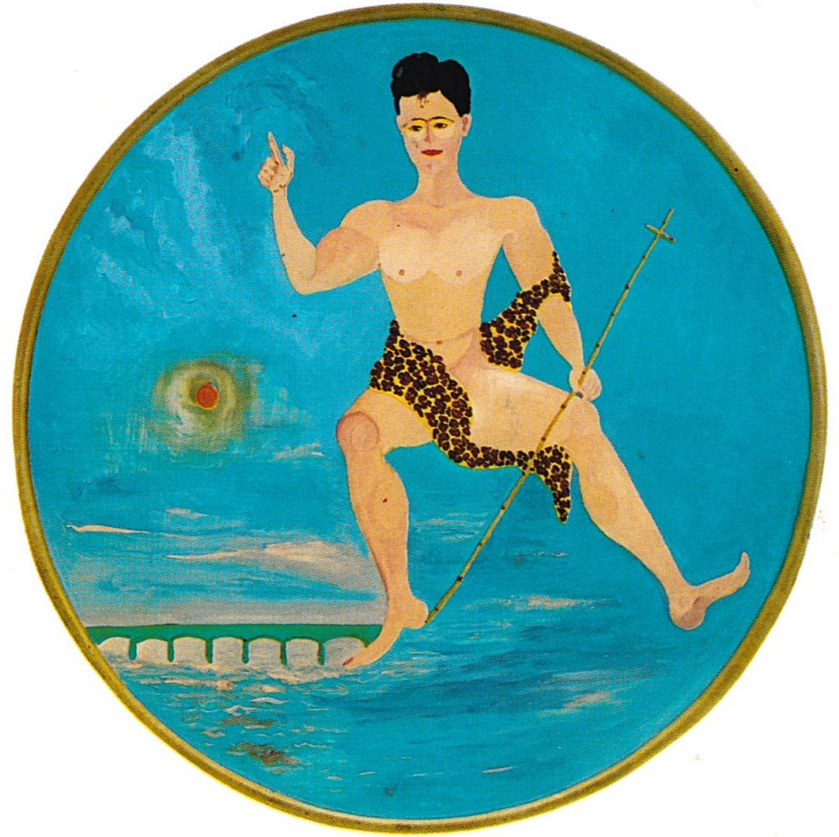
SAN GIOVANNINO IL BATTISTA