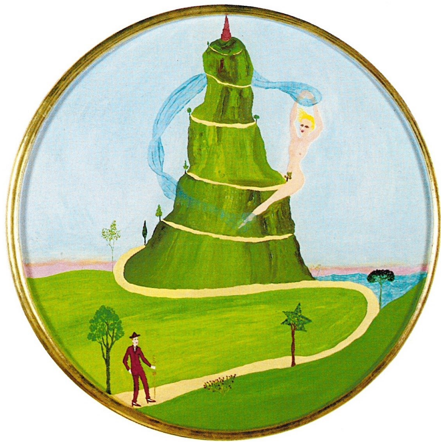
ECO E DECORO