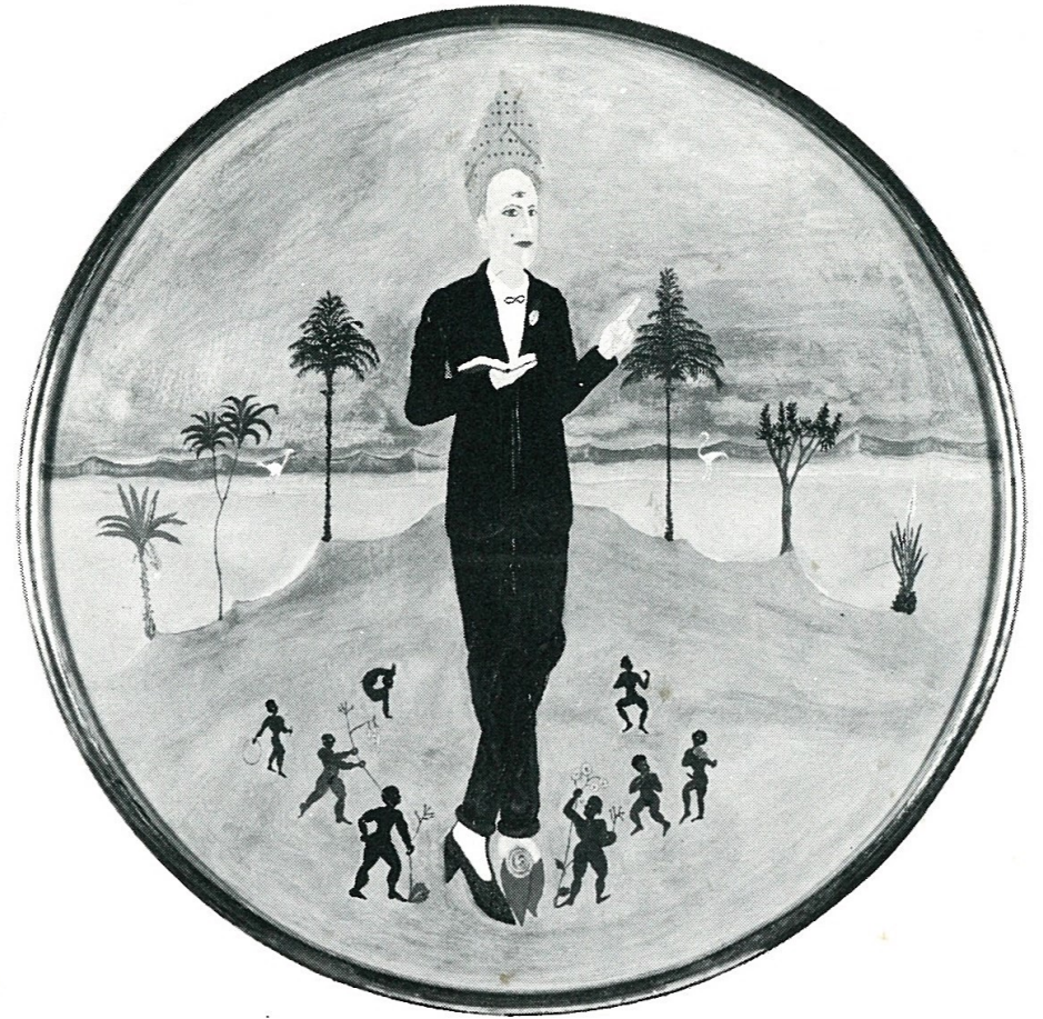
PIGMALIONE E PIGMEI