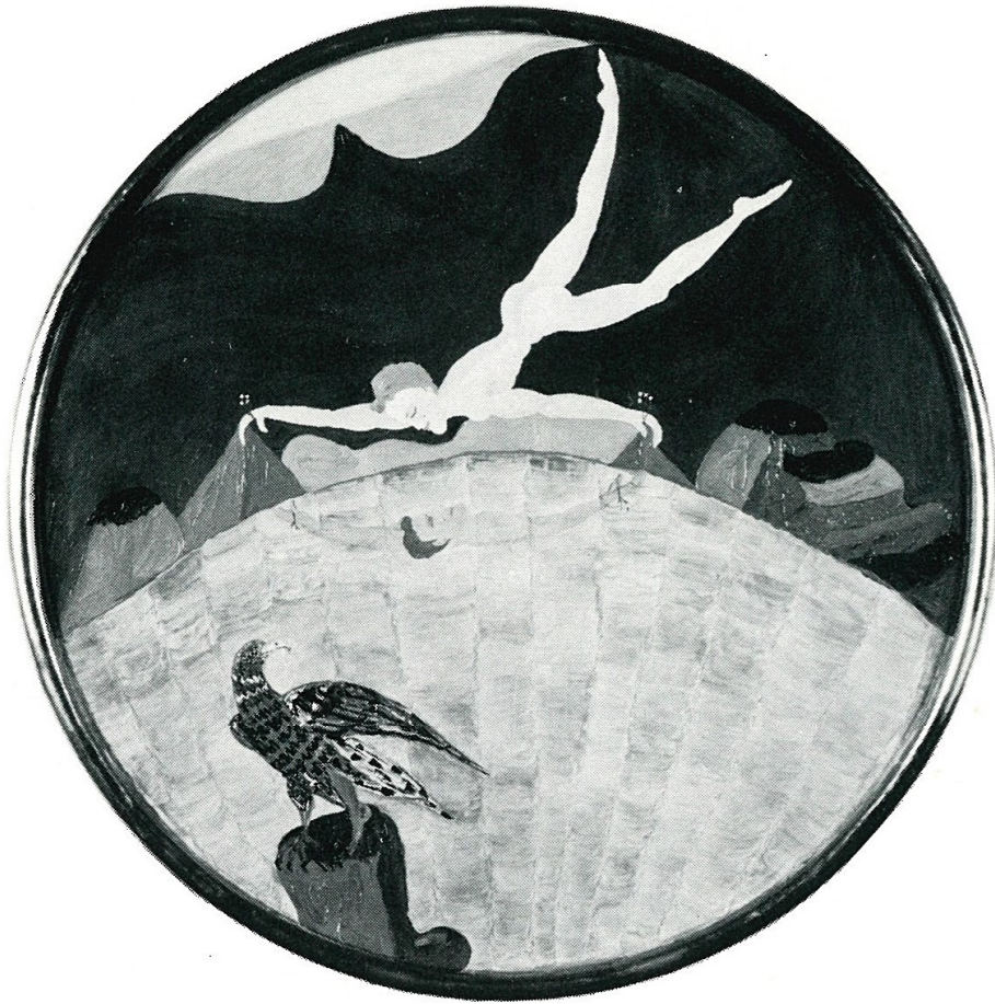
NARCISO E NARS