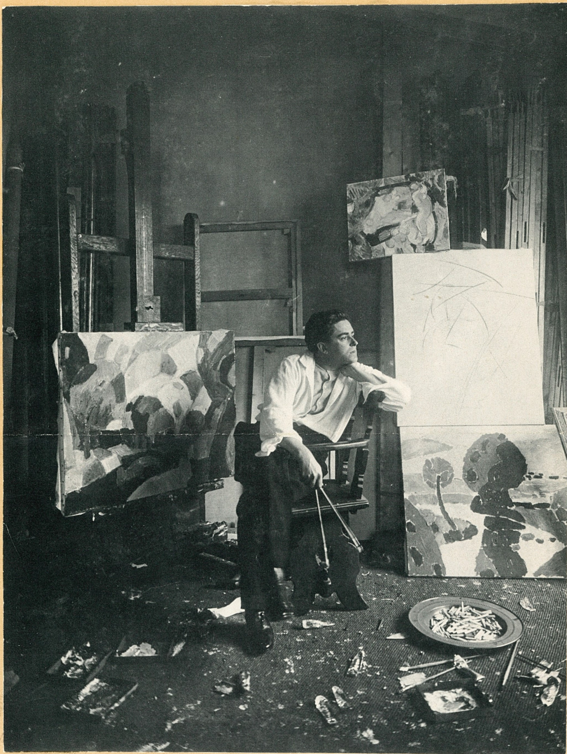
Picabia dans son atelier Av. Charles Floquet jeudi 9. Juillet 1914