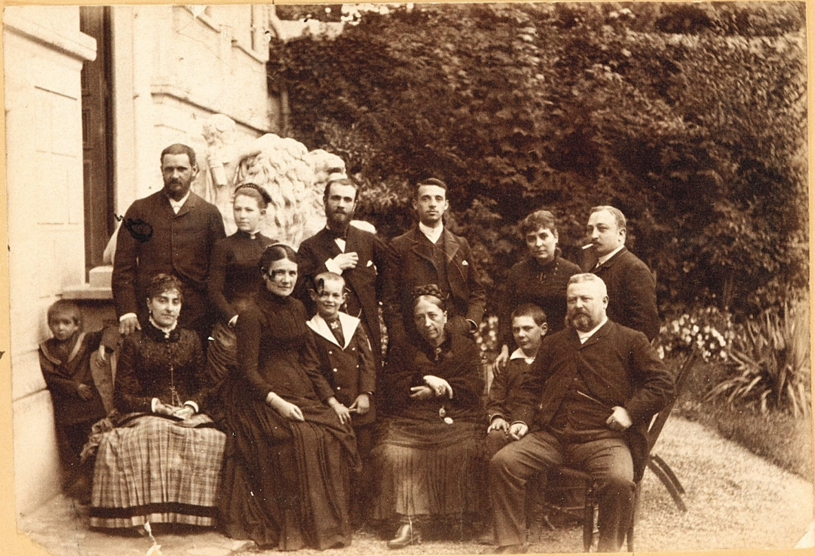
↑ je me demande ce que lui passe par la tête ?