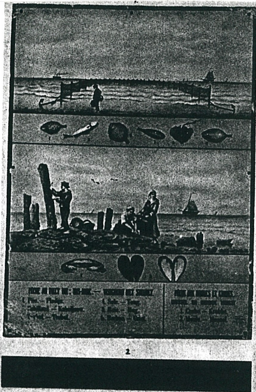
Marcel Broodthaers: Collected Editions.

Teatro della musica di Praga dal 20.1. al 24.2. si è aperta la mostra "La musica e le arti visive". Come è fatto alla mostra si è voluto storicizzare il rapporto tra musica ed arti visive presentando diversi esempi nel